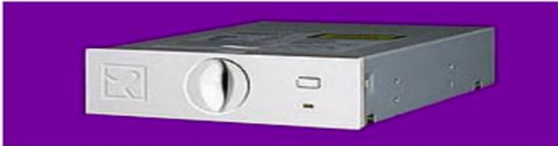
GenitalDrive model F ready for operation ( click to enlarge )